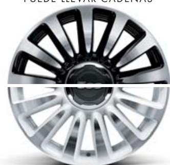
4WQ LLANTAS DE ALEACIÓN DE 16" 205/55 R16 BLANCO DIAMANTADO, PUEDE LLEVAR CADENAS