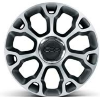
5EQ LLANTAS DE ALEACIÓN DE 17" 225/45 R17 ECOREFLEX DIAMANTADO BRUNEX BRILLANTE