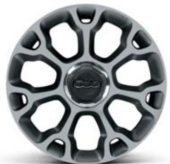
68Q LLANTAS DE ALEACIÓN DE 17" 225/45 R17 ECOREFLEX DIAMANTADO BRUNEX MATE