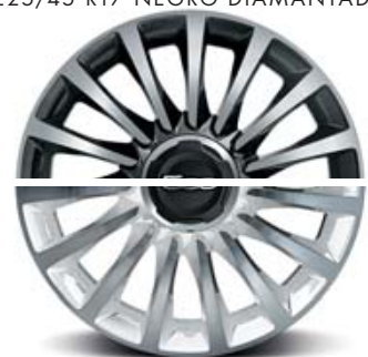
LINEACCESSORI LLANTAS DE ALEACIÓN DE 17" 225/45 R17 BLANCO DIAMANTADO