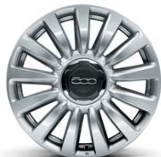
433 LLANTAS DE ALEACIÓN DE 16" 205/55 R16 GRIS BRILLANTE, PUEDE LLEVAR CADENAS