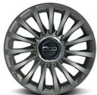
LINEACCESSORI LLANTAS DE ALEACIÓN DE 17" 225/45 R17 GRIS ECOREFLEX